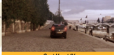
Quai Henri IV