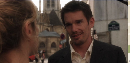
Rue Saint-Julien Le Pauvre