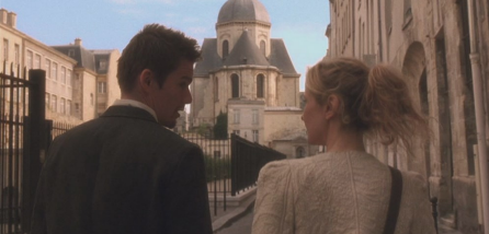
Rue des Jardins Saint-Paul