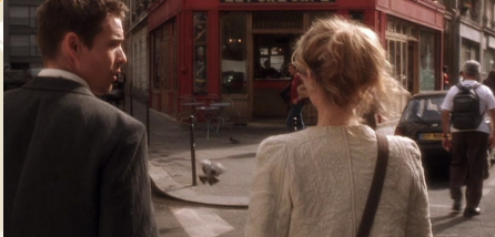
Le Pure Café, 14 rue Jean Macé