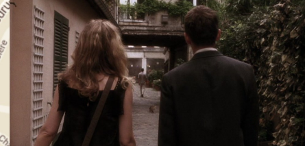
Cour de l'étoile d'or, Faubourg St-Antoine