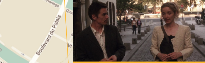
Rue Saint-Julien Le Pauvre