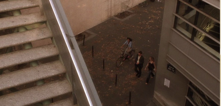
90 avenue Daumesnil