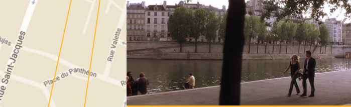
Quai de la Tournelle